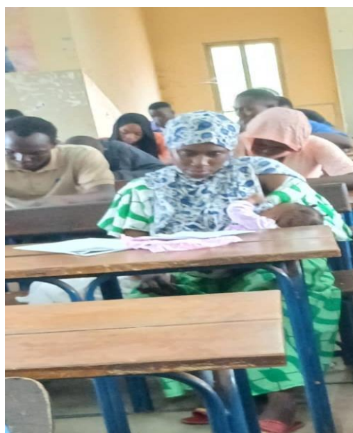
Photo3: une étudiante d'un autre niveau avec enfant dans la salle d'examen