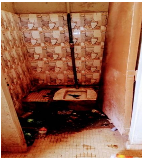
Photo 1 : l'état des toilettes à la Faculté d'histoire et de Géographie