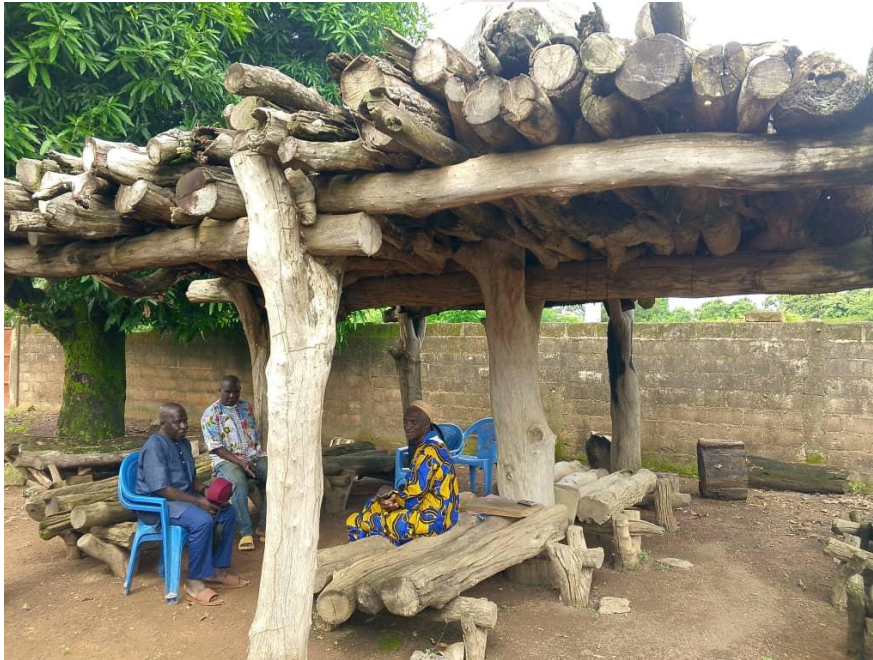
Image 2 : Le chef de terre de Kolia, KONE Yassoungo en boubou pagne à droite et deux de ses notables à gauche sous un préau traditionnel