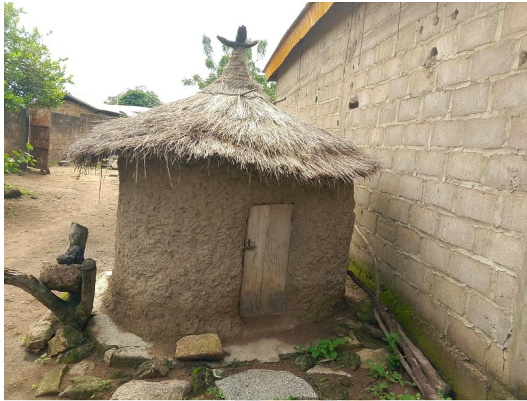
Image 3: La case des ancêtres dans la cour du chef de terre de Kolia

Source : COULIBALY Yalamoussa, le 8 septembre 2025